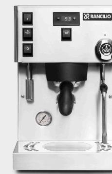
SILVIA PRO X