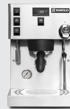
SILVIA PRO X