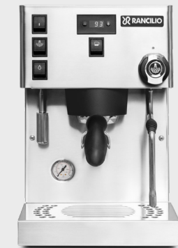
SILVIA PRO X